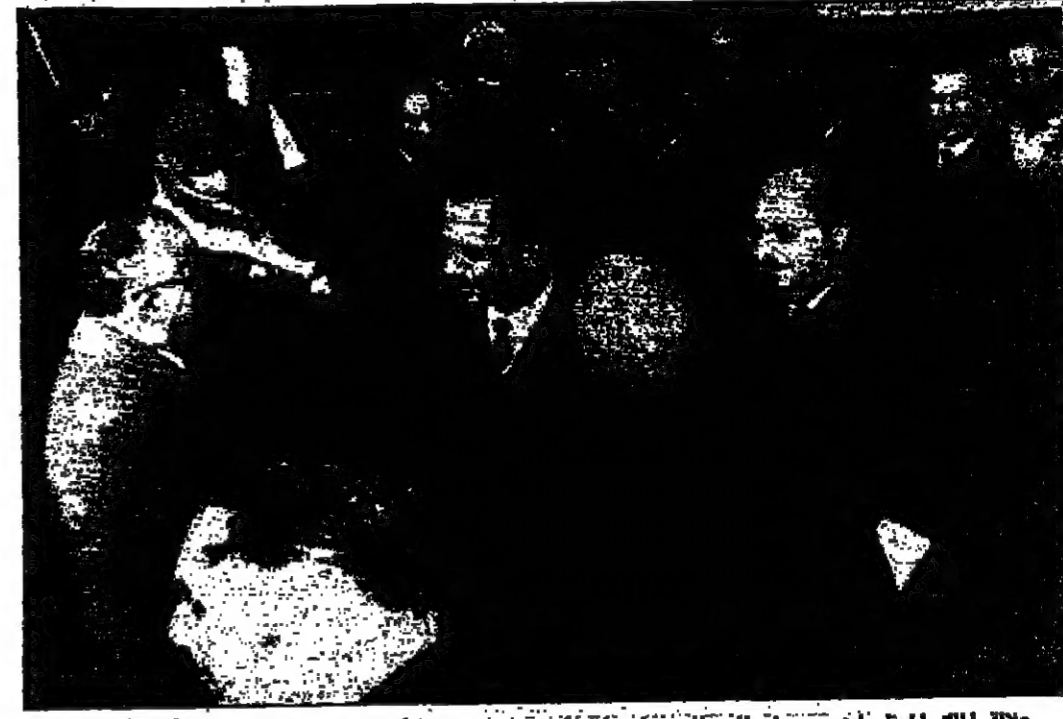
جلالة الملك العظيم لدى وصوله المطار حين ظهر امس غدا بزعامة الله من القاهرة يحيط به الوزراء وكبار رجال الدولة ( تصوير و.ا.و. )